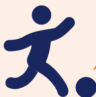
Huidig Schieten of passen