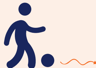
Nieuw Dribbelen, schieten of passen